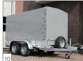
10 Optional: telo e centina ( diverse altezze disponibili ) e ruota di scorta fissata con supporto sul fronte del rimorchio.