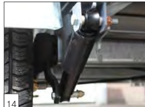
14 Optional: ammortizzatori montati sugli assi.