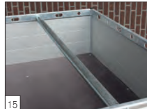
15 Optional: tubo ferma carico montato sulla griglia d'aggancio sopra le sponde ( combi protect rail ).