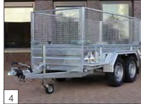
4 Optional: sovrasponde in acciaio rinforzate.