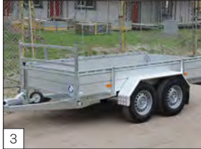
3 Optional: fermacarico anteriore rinforzato, parafanghi in alluminio grecato rinforzato.