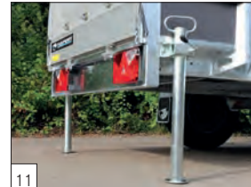
11 Optional: piedini di stazionamento posteriori con relative morse.