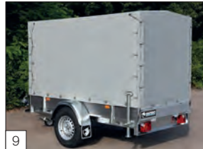
9 Optional: telo e centina ( diverse altezze disponibili), e piedini di stazionamento posteriori.