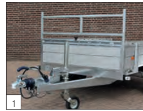
1 Standard: supporto porta scala anteriore (ferma carico).