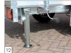
12 Optional: piedini telescopici con manovella, rotabili a 90° in ordine di marcia (1000kg ciascuno).