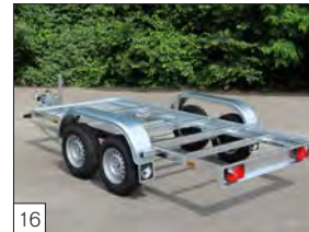
16 Optional: modello l-2 " chassis " prevede piu' possibilita' di pavimentazione.