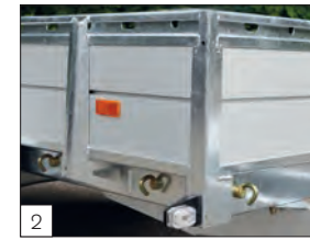
2 Optional: ganci di fissaggio avvitabili all'esterno del piano di carico.