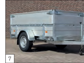
7 Optional: sovrasponde in alluminio da 40 cm con relativi piantoni angolari di aggancio.