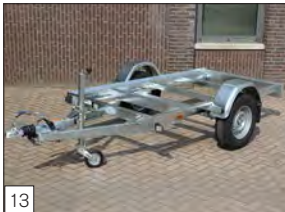
13 Optional: modello L-1 " chassis " disponibile sia in versione senza freno, che frenato.