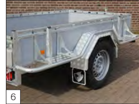
6 Optional: staffe protettive in alluminio ( pezzo unico), anteriori, posteriori e sopra i parafanghi. Fornito con pedana in alluminio.