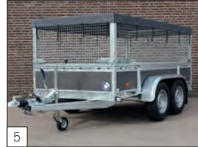
5 Optional: sovrasponde in rete elettrosaldata, zincate a caldo (h. 70 cm) e telo di copertura con agganci alle sovrasponde.