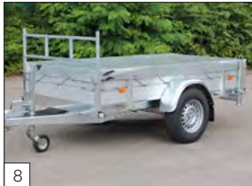
8 Optional: telo di copertura filo sponda.